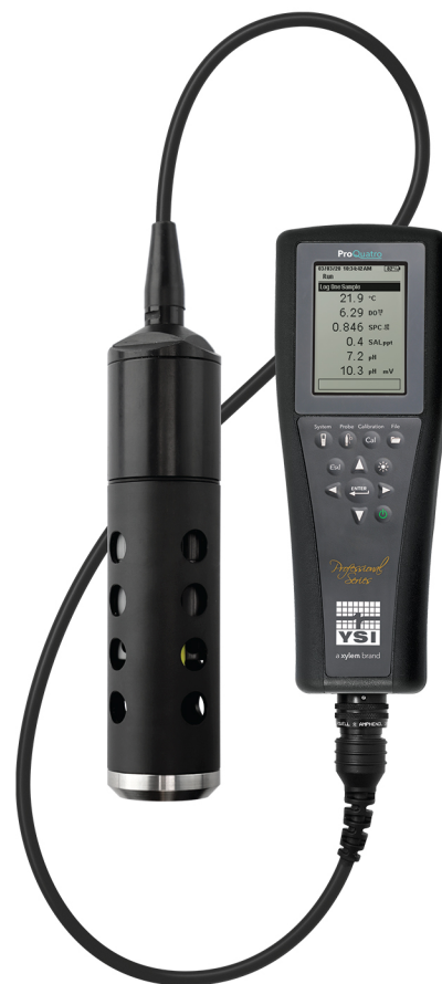
ProQuatro手持仪和 4 端口电缆组件最多可同时与四个传感器配合使用。